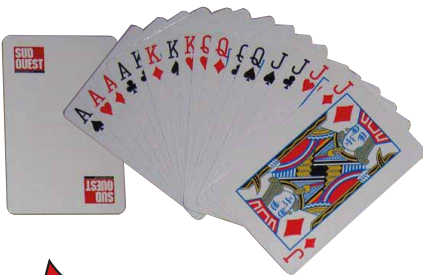
Jeu de cartes