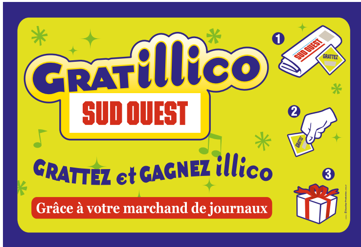
Tapis de bar