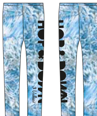
Legging Hop and Down