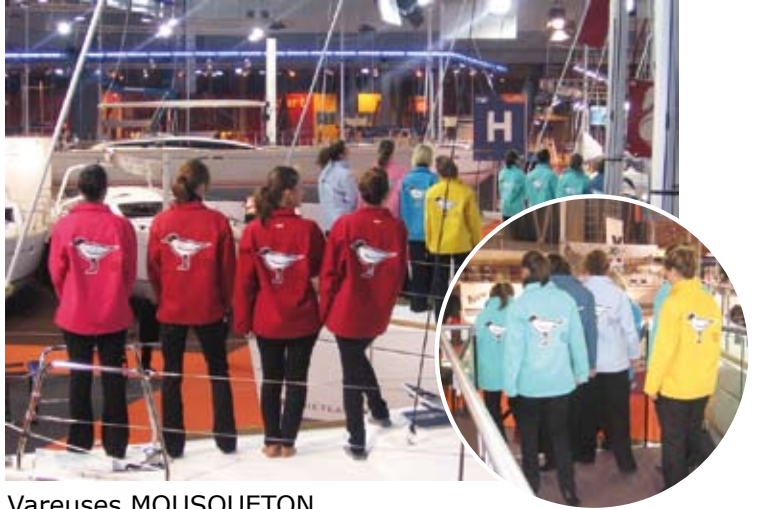
Vareuses MOUSQUETON www.vareusemousqueton.com