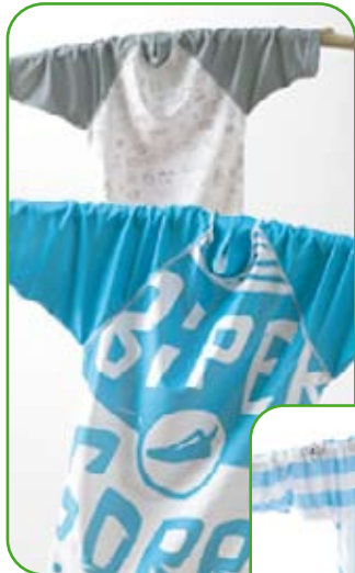
Lycras de surf