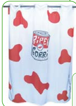
Rideau de cabine