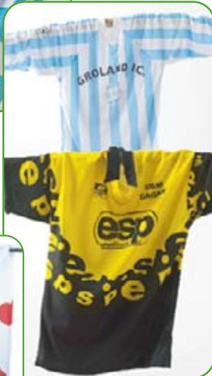
Maillots de sport